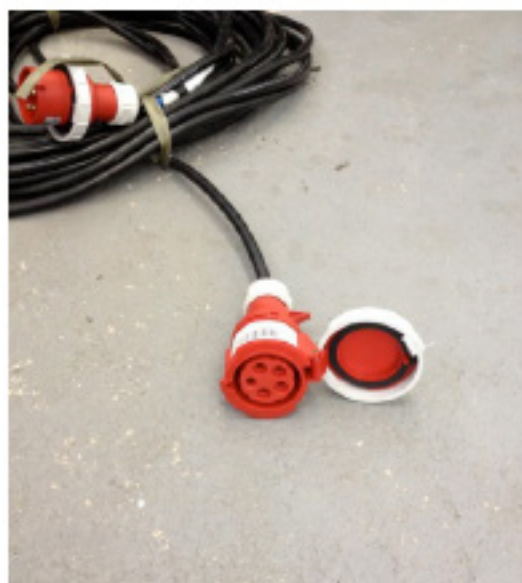
Ponta do cabo fornecido a partir de 01/01/2014