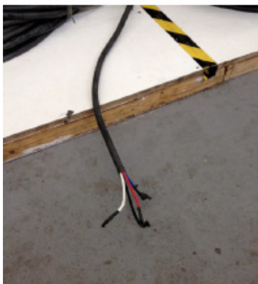
Ponta do cabo fornecido até 31/12/2013