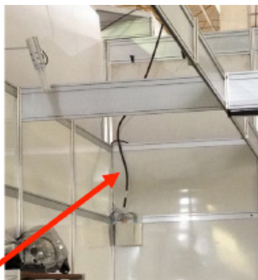
Cabo fornecido pelo Expo Center Norte